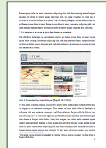
Abbildung im Fließtext